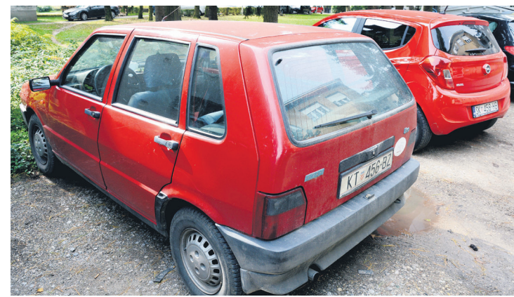
ODNOS NOVIH VOZILA PREMA RABLJENIM VOZILIMA REGISTRIRANIM U RH PRVI PUTA

dima po pojedinim sklopovima automobila. Stoga smo upravo CVH priupitali za mišljenje što je razlog takvom trendu. Naime, djelokrug ovlasti CVH-a podrazumijeva obavljanje poslova organiziranja i jedinstvenoga provođenja tehničkih pregleda vozila i obavljanje poslova organiziranja poslova registracije vozila u stanicama za tehnički pregled vozila. Kako tumači rukovoditelj Tehničkog odjela Centra za vozila Hrvatske (CVH) Tomislav Škreblić, razlog je kupnja starijih automobila koji su cjenovno pristupačniji. "Građani se zbog smanjene kupovne moći sve više okreću ka kupnji starijih automobila. Porast prosječne starosti ima značajni utjecaj na prosječnu neispravnost koja će biti zabilježena na toj kategoriji vozila, za koju se, kako će se trend nastaviti, također očekuje da će